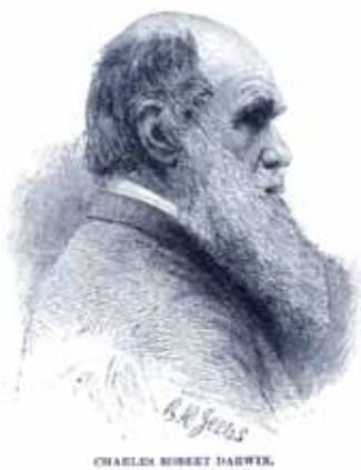
Aus: Bolton, Sarah K. Famous Men of Science. NY: Thomas Y. Crowell & Co., 1889

Lassen Sie sich anstecken vom Geist der Revolution im Verständnis unseres eigenen Daseins!