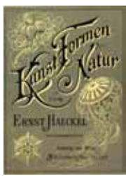
Aus: Haeckel, Ernst. Kunstformen der Natur. Leipzig und Wien: Bibliographisches Institut, 1904